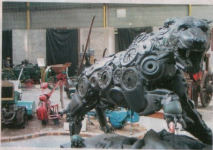
L'été, le musée du Moteur à Bagneux accueille les œuvres d'artistes plasticiens comme cette sculpture de panthère uniquement en pièces de moteur

Peinture, sculpture, installation, les expressions sont diverses, mais à y regarder de près, il y a toujours un rapport, plus ou moins important, avec le moteur.