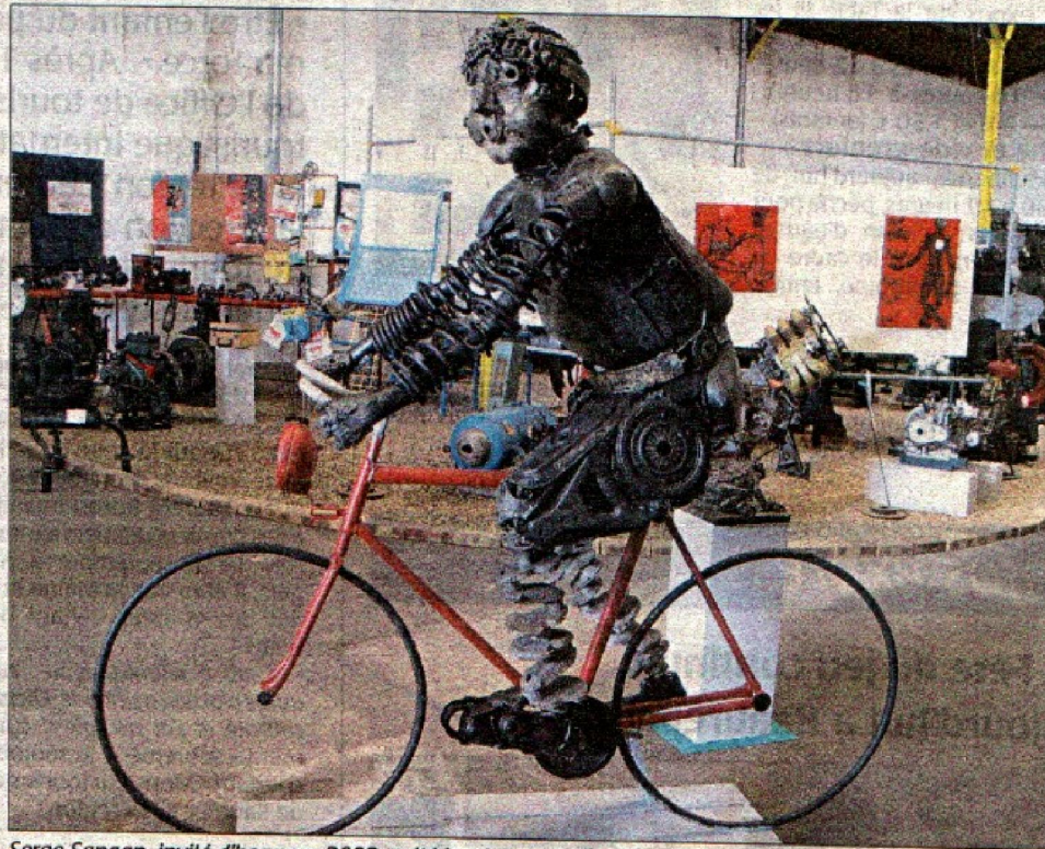
Serge Sangan, invité d'honneur 2008, a été inspiré par la Semaine fédérale du cyclotourisme qui se déroulera début août à Saumur

« Art et Moteurs 2008 » au Musée du moteur jusqu'au 21 septembre. Ouvert du mardi au samedi de 14 heures à 18 heures, 18 rue Alphonse-Caillaud à Bagnaux. L'exposition est comprise dans la visite du musée, 5 € pour les adultes et 2,50 € pour les enfants.