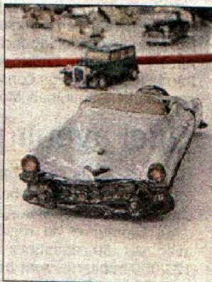
Les voitures anciennes ont inspiré la céramiste Véronique Plault, qui a créé cette Cadillac de 1952