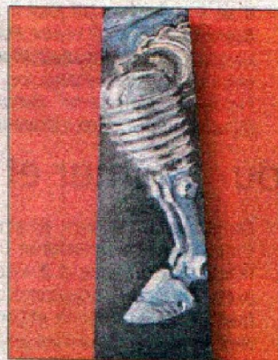
« Bain d'huile », une huile sur bois de Carlos Jimenez. Le hasard a donné à l'œuvre une étonnante similitude avec le sabot d'un cheval