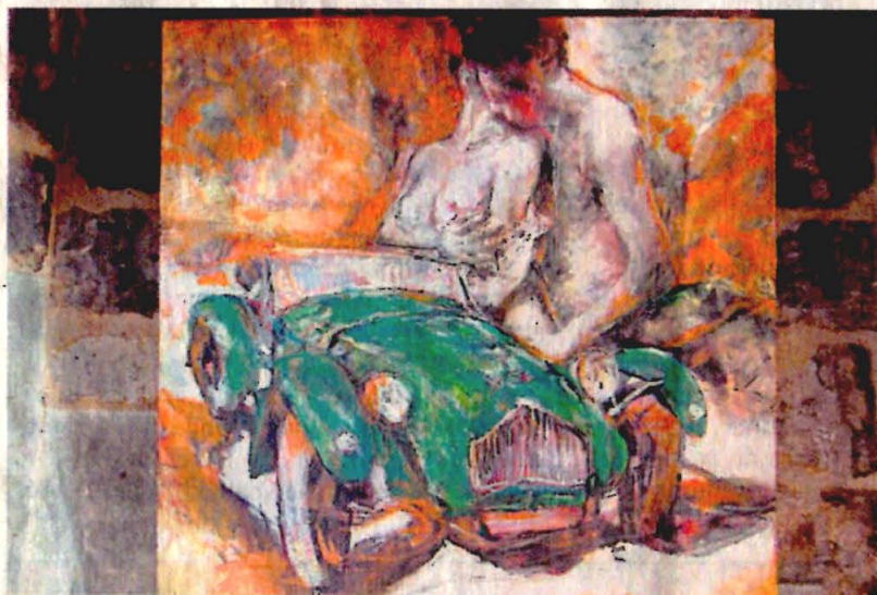
Gregor Jakubowski a réalisé plusieurs huiles pour l'entreprise Chapal, dont le patron était passionné de course automobile.

totallement gratuit. Les œuvres seront ensuite visibles jusqu'en septembre dans le cadre de la visite du musée (7 €, 3 € de 10 à 16 ans). Musée du Moteur, 18, rue Alphonse-Caillaud à Bagneux.